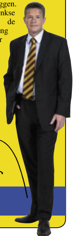
Frank Vanhecke Voorzitter Vlaams Belang

In oktober, bij de gemeenteraadsverkiezingen, kunt u zeggen wat u daar van denkt.