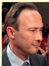
Bruno Valkeniers Vlaams Belang-voorzitter

“Een kordate aanpak van de criminaliteit blijft uit. Tot ergernis van de rechters, tot frustratie van de politie, tot onvrede van de samenleving en tot groot jolijt van de criminelen.