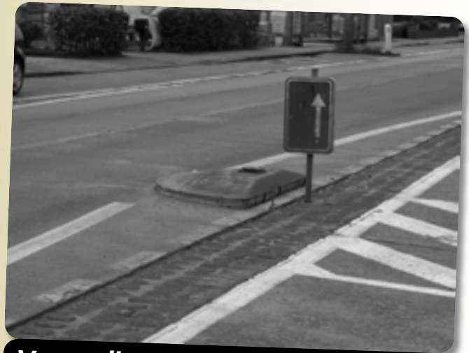
Versmalling Stationsstraat: Gevaarlijk en slechte signalisatie

Onze fractievoorzitter Johan Cools vroeg in de gemeenteraad ook dat de gemeente oplossingen zou uitwerken om het stijgende aantal verkeersborden in te perken. Het invoeren van de drie snelheidszones (30, 50 en 70) kan een eerste stap zijn doch uit al het voorgaande blijkt dat er veel meer nodig zal zijn.