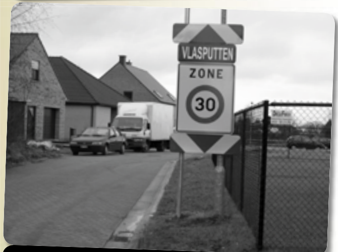
Om ter grootst, in de woonwijk! Prijkaartje: 250€/zone 30