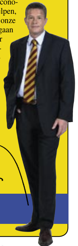
Frank Vanhecke Voorzitter Vlaams Belang

Willen wij onze economie er bovenop helpen, dan moeten we onze eigen boontjes gaan doppen. Zonder Waalse bemoeienissen. Alle Vlamingen hebben er dus belang bij dat Vlaanderen onafhankelijk wordt.