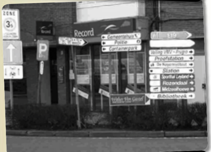
Een wirwar van aanduidingen op de markt