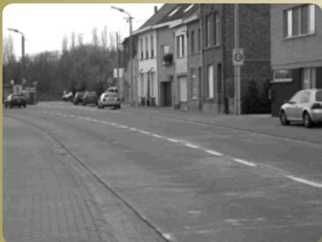
Om ter kleinst, op de Mechelse- steenweg